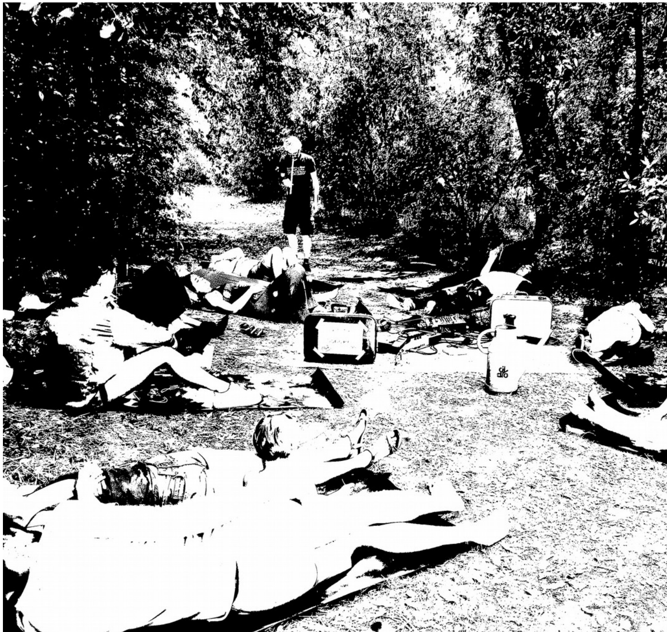
sieste sonore au Château d'Espeyran – Festival ACTE #2 – Juin 2022